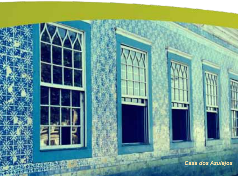
Casa dos Azulejos

Mesmo com o grande desenvolvimento, foi somente na República a Freguesia de São Pedro se transformou em Vila. Em 17 de dezembro de 1982, São Pedro ganhou autonomia administrativa e se separou de Cabo Frio.